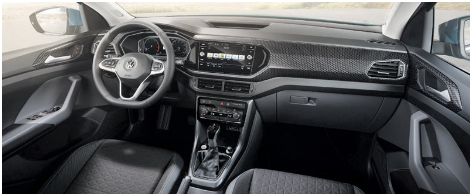
Vom Musikhören über die Smartphone-Mediathek bis zum Bedienen eines optionalen 8-Zoll-Infotainment-Touchscreens: Die Palette an technischer Ausstattung kennt beim T-Cross (fast) keine Grenzen – und gibt dem Interieur das gewisse Etwas.

Vernetzung zwischen Interieur und Exterieur statt. Dabei harmoniert das sportliche Innere mit den zwölf Farben der äußeren Erscheinung. Von Beginn an bietet Volkswagen den T-Cross außerdem in verschiedenen Bi-Color-Lackierungen an, um auch außergewöhnliche Gestaltungen zu ermöglichen.