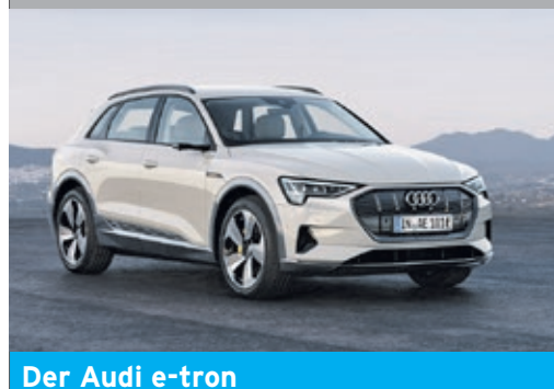
Der Audi e-tron