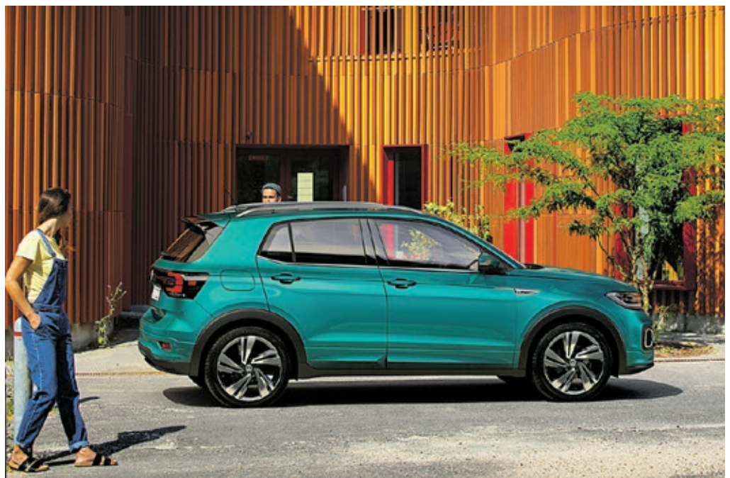
Der Volkswagen T-Cross wurde zum Zeitpunkt des Redaktionsschlusses noch nicht zum Kauf angeboten. Er besitzt noch keine Gesamtbetriebserlaubnis und unterliegt daher nicht der Richtlinie 1999/94/EG.

werfer – ergänzen zudem die Motorhaube. Dagegen befindet sich selbiges im Falle einer gewählten LED-Beleuchtung oben im Scheinwerfergehäuse. Seitlich trennt eine scharf geschnittene Charakterlinie die Flächen und sorgt gleichzeitig für einen kraftvollen Schulterbereich. Quer gespannt und von einer schwarzen Blende eingerahmt definiert ein Reflektorband dann den Übergang zum Heck. Über zweifarbige Dashpads findet eine reibungslose