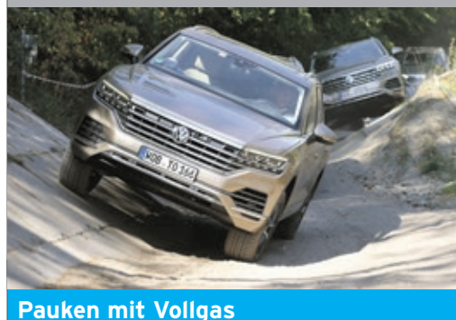
Paufen mit Vollgas