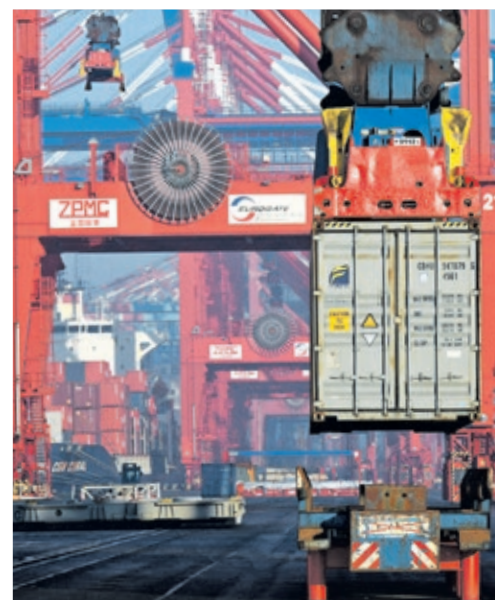
Moderne Hafentechnik macht einen reibungslosen Ablauf erst möglich.