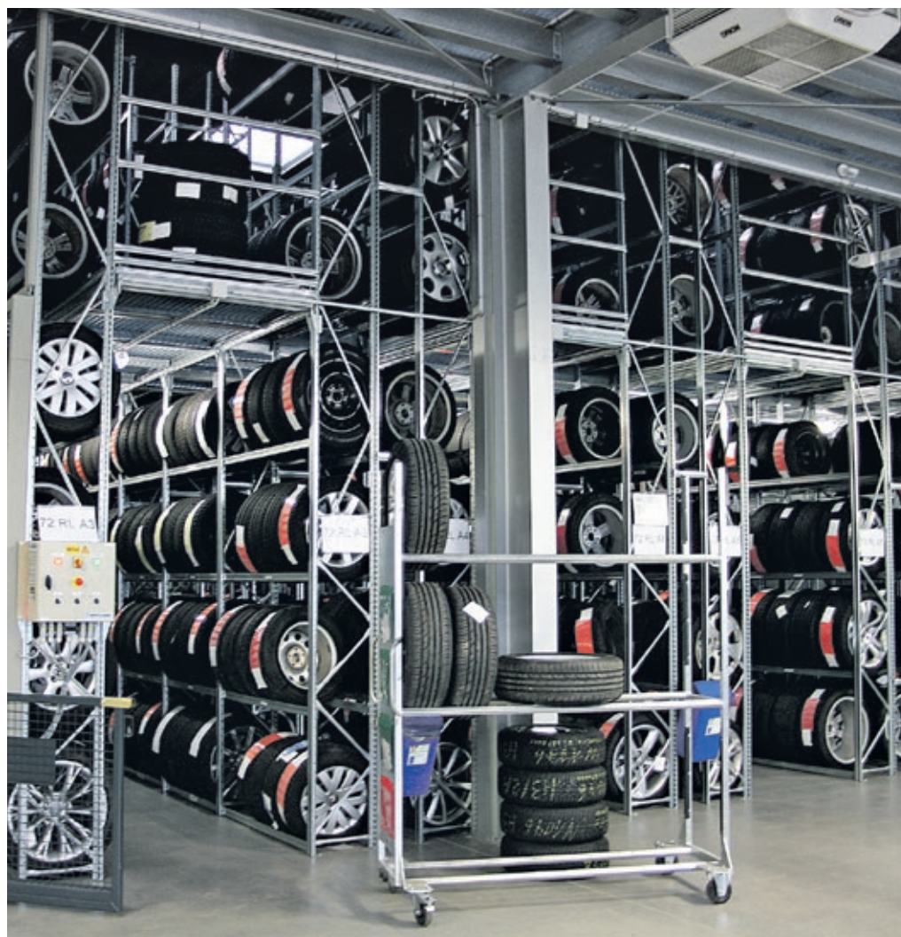
Um Risse im Reifen zu vermeiden, lagern Autoreifen stehend in speziellen Regalen.

Haben Fahrzeughalter zu Hause keinen geeigneten Aufbewahrungsort oder ist ihnen die Vorbereitung und Pflege zu kompliziert und aufwendig, hilft zum Beispiel ihr Autohaus weiter, was gleich mehrere Vorteile bietet: Es garantiert eine fachgerechte Pflege und Einlagerung im Autohaus. Die Reifenlager von Schmidt + Koch erfüllen alle Anforderungen zur Unterstützung der Langlebigkeit und unterliegen ständiger Überprüfung. Um die mühselige Vorabreinigung der Räder müssen sich Eigentümer nicht kümmern, da diese von Schmidt + Koch übernommen wird. Eine Hochdruck-Waschmaschine entfernt selbst eingebrannten Bremsstaub von den Felgen. Jeder Satz erhält einen eigenen Lagerort im mehrstöckigen Regalsystem,