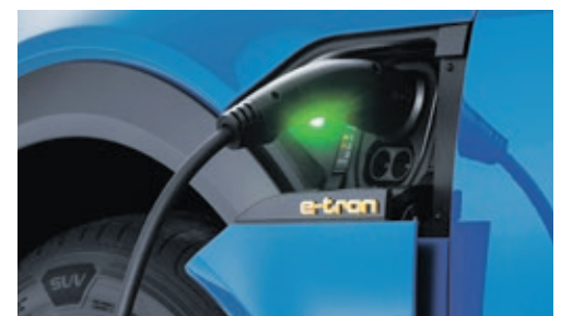
Die Ladeklappe lässt sich auf Wunsch um ein zweites Exemplar erweitern.