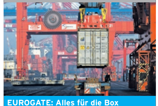
EUROGATE: Alles für die Box