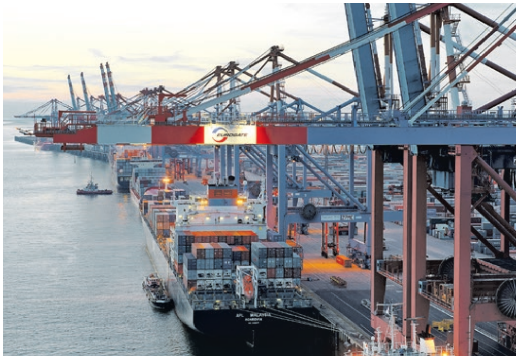
Beindruckend: der EUROGATE Container Terminal Bremerhaven

Steffen Leuthold versichert: „Bei EUROGATE hat der Schutz der natürlichen Ressourcen und der Umwelt eine lange Tradition. Solar- und Windkraftanlagen sind bereits an den Terminals installiert.“ Bis 2020 sollen 25 Prozent der CO 2 -Emissionen und 20 Prozent des Energieverbrauchs pro Container gesenkt werden. Ein Ziel, das beispielsweise mit einem eigens installierten Energie-Management-System erreicht werden soll. Die Bemühungen EUROGATES führten