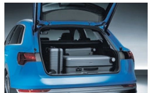
Mit 660 Liter Gesamtladefolumen ist der Audi e-tron auch für den Familienurlaub geeignet.