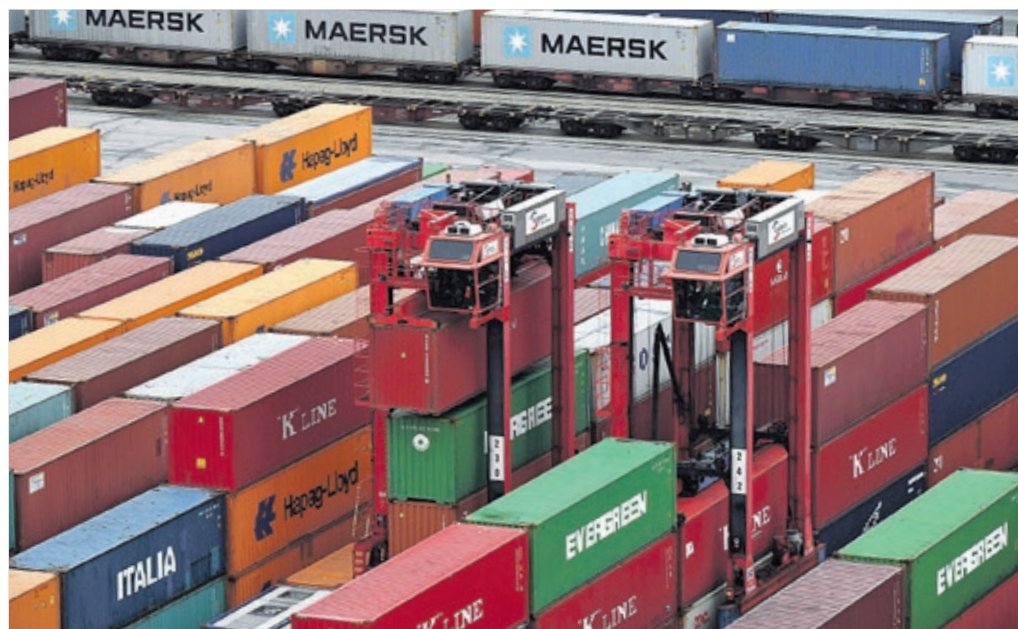
7 Millionen Container werden jährlich von EUROGATE in Bremerhaven bewegt.