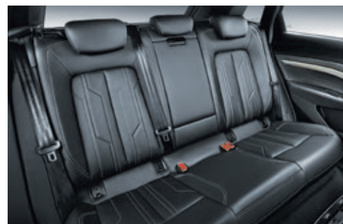
Auf der geräumigen Rückbank des e-tron finden auch drei Erwachsene bequem Platz.

Auch in Sachen Höchstgeschwindigkeit, die bei starken 200 km/h liegt, steht der Wagen seiner kraftstoffbetriebenen Konkurrenz in nichts nach. Zur maximalen Beschleunigung kann das Auto zudem in den Boost-Modus schalten und so die Leistung für acht Sekunden auf 300 kW (408 PS) steigern. Um die Versorgung mit Stromtankstellen sicherzustellen, befindet sich derzeit eine entsprechende Ladeinfrastruktur im Aufbau. Hierfür hat Audi gemeinsam mit anderen Herstellern das Joint-Venture-Unternehmen Ionity gegründet, das ein Netz von öffentlich zu-