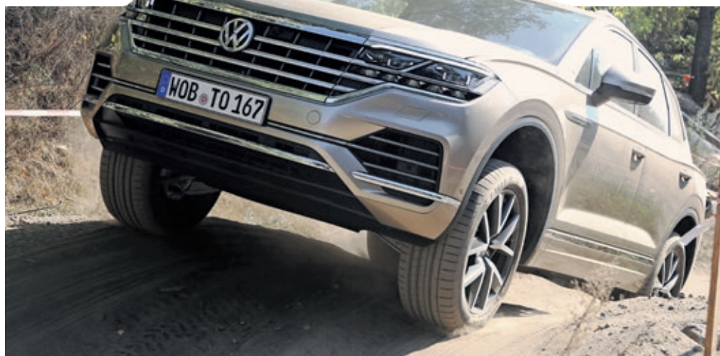
Souverän über die Buckelpiste – so macht Fahrbeherrschung Spaß.

In die schneeglitzernde Weite Nordschwedens hat Volkswagen eisige Dynamikflächen und über 40 Streckenvarianten gesetzt. Das Ziel der bis zu viertägigen Ice Adventures: in atemberaubender Naturkulisse den perfekten Drift übers spiegelglatte Eis zaubern. Wie bei den Pendanten in Österreich richtet sich auch das skandinavische Angebot an Einsteiger, Könnern und kühne Quertreiber und dauert zwischen drei und vier Tage. Wer zwischen den animierenden Schneefontänen Lust auf Erkundungen bekommt, tauscht optional Gaspedal gegen Schneeschuh, geht auf Elchsafari oder thront