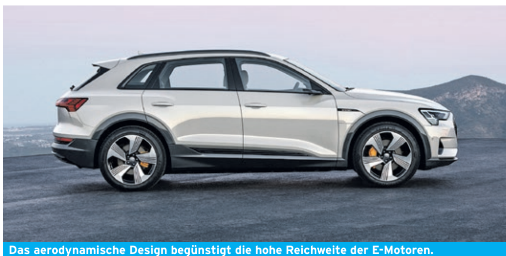
Das aerodynamische Design begünstigt die hohe Reichweite der E-Motoren.

Etwa 30 Prozent seiner enormen Reichweite erlangt der Elektro-SUV durch sein modernes Rekuperationskonzept: Dank des speziell entwickelten und weltweit einzigartigen Energierückgewinnungssystems rekuperiert der Audi e-tron mit bis zu 300 nM Drehmoment und 220 kW (299 PS) Leistung - und gewinnt so fast 70 Prozent der aufgebrauchten Leistung durch die ausgereifte Energiespartechnik zurück. Bei Testfahrten in den Rocky Mountains vergrößerte sich die Reichweite pro bergab zurückgelegtem Kilometer durchschnittlich um einen weiteren Kilometer. Kein anderes Serienmodell weltweit weist derzeit ähnlich starke Werte auf.