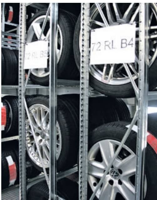
Reifen verlangen nach einer dunklen, trockenen und kühlen Lagerung.