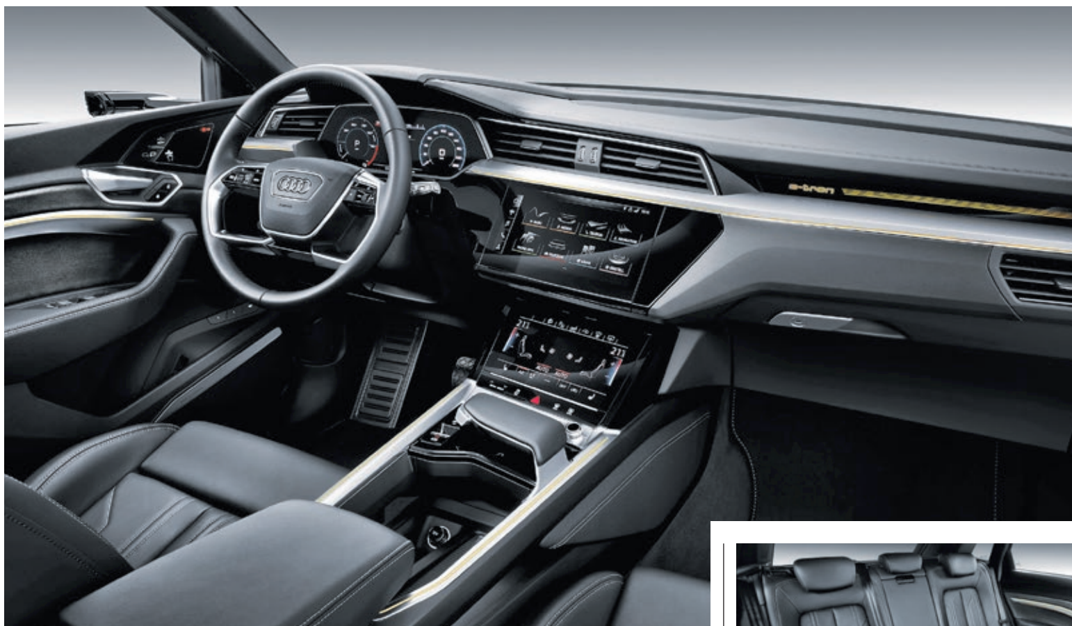
Digitalisiertes Cockpit: Das bordeigene MMI informiert über Batteriestand und Reichweite und beinhaltet zudem ein vielfältiges Infotainment-Angebot.

Auf Situationen wie Glätte reagiert der rasante Elektrowagen dabei deutlich schneller als etwa mit der konventionellen quattro-Technik. Weiter steht ein Offroad-Modus zur Verfügung, der abseits der Asphaltstraße höchsten Ansprüchen an Sicherheit und Fahrvergnügen genügt. Dabei ist der neue e-tron mit einer einzigen Batterie Ladung in der Lage, satte 400 Kilometer ohne zwischenzeitliches Stromtanken zurückzulegen, womit er sich auch bestens für längere Distanzen eignet. In der Praxis erweist sich der Neuzugang daher als absolut alltagstauglich.