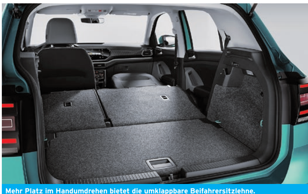
Mehr Platz im Handumdrehen bietet die umklappbare Beifahrersitzlehne.

Schon in der frühen Entwicklungsphase machten sich die Designer via Augmented Reality ein Bild vom Innenraum und erlebten den T-Cross live. Um ihn weiter zu perfektionieren, passten sie die Ergonomie und das Ambiente so vollständig an die Bedürfnisse der Insassen an. Per Smartphone-Mediathek oder Streamingdienst genießen Kunden während der Fahrt über das auf Wunsch integrierte „Beats“-Soundsystem mit 300 Watt und Subwoofer ihre Lieblingsongs. Dann hallt die Musik durch das technisch anspruchsvoll bestückte Interieur.