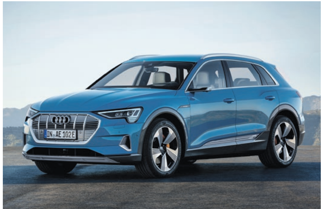
Typisch Audi: Der markante Singleframe sorgt für großen Wiedererkennungswert.

Eine Weltneuheit sind auch die auf Wunsch integrierten virtuellen Außenspiegel. Anstelle des gewöhnlichen Spiegels befinden sich an den Seitentüren installierte Außenkameras. Diese senden in Echtzeit Bilder auf 7 Zoll große OLED-Displays, die sich im Cockpit des Fahrzeugs in den Türen befinden und als virtuelle Außenspiegel dienen. So hat der Fahrer die Möglichkeit, vorprogrammierte Einstellungen zu verschiedenen Fahrsituationen wie etwa Abbiegen, Parken oder Fahren zu nutzen, um auf jede Verkehrssituation perfekt zu reagieren. Gerade bei Regen und Dunkelheit bietet dies bessere und klarere Sichtverhältnisse als herkömmliche Außenspiegel. Zudem sorgt der hierdurch reduzierte Luftwiderstand bei einer Geschwindigkeit von 130 km/h für eine Energieersparnis von etwa 5 Prozent und weniger störende Windgeräusche. Vorausschauendes Beschleunigen und Verzögern ermöglicht der serienmäßige Effizienzassistent, der Sensor- und Navigationsdaten sowie Verkehrszeichen selbsttätig auswertet und so ebenfalls zur Effizienzmaximierung und Energieersparnis beiträgt. Dies geschieht über eine vollautomatische Anpassung der Fahrtgeschwindigkeit an spezifische Verkehrssituationen, etwa bei Tempolimit, in Kreisverkehren oder vor Abbiegemanövern. Zusammengefasst erhöht sich die elektrische Reichweite des e-tron