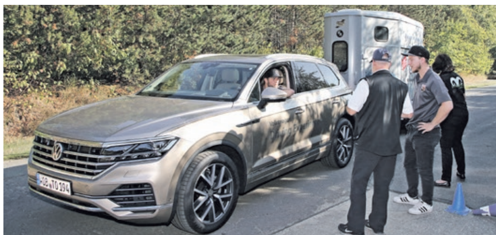
Wachsam, vorfreudig und ein wenig aufgereggt wartet der Fahrer auf den Start.

auf einem Schneemobil. In den Preisen zwischen 2.675 und 3.940 Euro sind neben Schulung und Equipment Anfahrt, Verpflegung und Übernachtung in der Mini-Suite des Hotels Laponia enthalten.