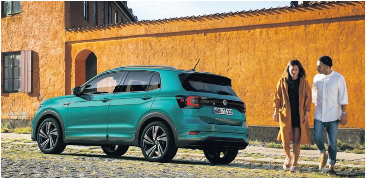
Eingerahmt von einer schwarzen Blende: Ein Reflektorband schafft quer gespannt die reibungslose Verbindung zum Heck.

► Maskulines Design trifft digitale Vernetzung: Neben zahlreichen Individualisierungsmöglichkeiten bietet der neue Volkswagen T-Cross ein markantes Gesicht mit dominantem Grill. Digital und vernetzt bewältigt der Einsteiger unterschiedliche Abenteuer auch über den Stadtverkehr hinaus und gehört zu den sichersten Fahrzeugen seiner Art. Assistenzsysteme aus höheren Klassen fließen in das Modell ein – und prägnante Nebelscheinwerfer weisen den Weg.