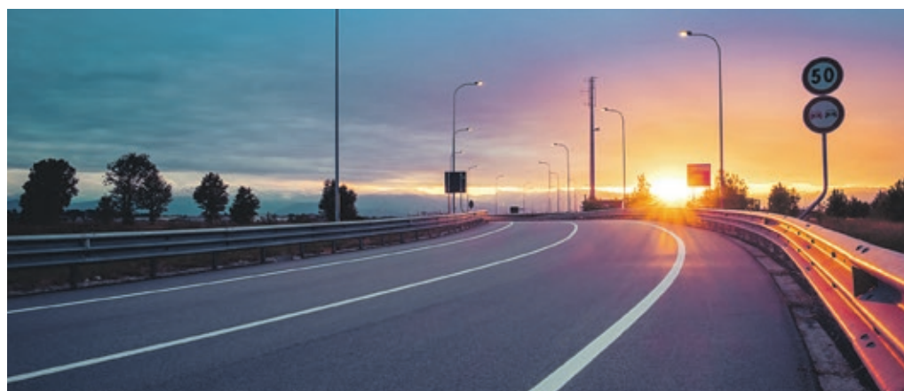
Einzelne Strahlen der untergehenden Sonne können Autofahrer verwirren.

▶ Nach einem Unfall wurde ein Fahrzeug, 6 Wochen zugelassen, Laufleistung 3.291 km, von der Besitzerin zum Netto-Restwert verkauft. Sie kaufte ein neues und versuchte, die Differenz zwischen dem von der Versicherung zugrunde gelegten Wiederbeschaffungswert und dem von ihr für den Unfallwagen ausgegebenen Kaufpreis als weiteren Schaden einzuklagen. Das Landgericht Bielefeld (Az. 2 O 47/17) und der 9. Zivilsenat des Oberlandesgerichtes Hamm (Az. 9 U 5/18 OLG Hamm) wiesen die Klage ab. Eine Abrechnung auf Neuwagenbasis kann nur erfolgen, wenn die Erstzulassung nicht länger als 4 Wochen zurückliegt und die Laufleistung 1.000 Kilometer nicht überschreitet. ◀