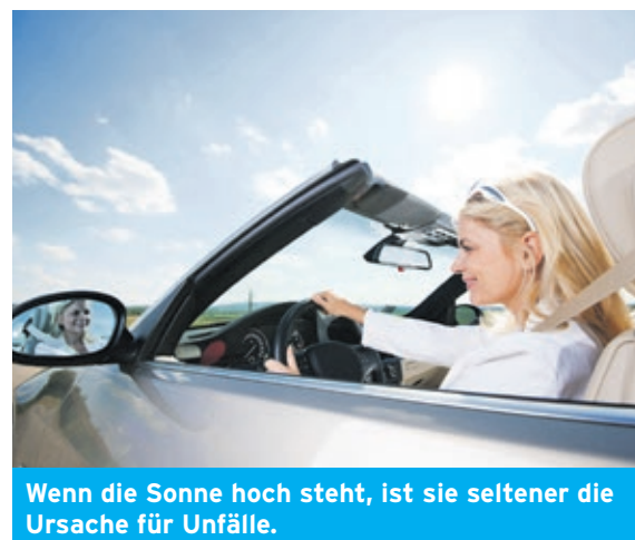
Wenn die Sonne hoch steht, ist sie seltener die Ursache für Unfälle.