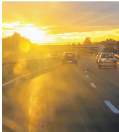
Blendet die Sonne frontal, kommt die Fahrt einem Blindflug gleich.

Für die Reinigung reicht ein Mikrofaser-tuch mit etwas Wasser und Spülmittel. Gewischt wird nur in eine Richtung. Von einem Einsatz von Spiritus sollte abgesehen werden, denn hier kann es zu Schmier-spuren kommen. Auch die vermeintlichen Scheibefrei-Helfer aus Sprühflaschen verursachen ein Problem, denn die Flüssigkeit entwickelt in Verbindung mit Schnee