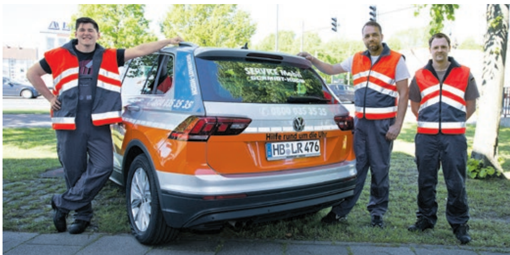
Das Team des Schmidt + Koch Notdienstes hilft in allen technischen Problemlagen weiter.

Weitere Informationen unter www.schmidt-und-koch.de oder www.facebook.com/schmidtundkoch