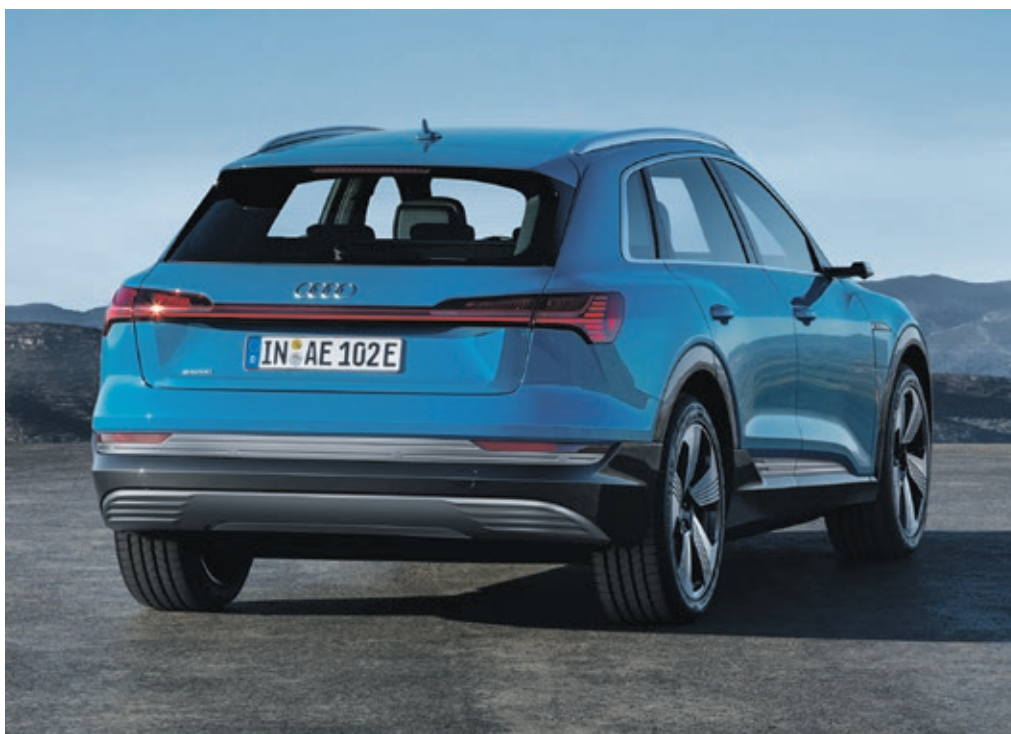
Mit 4,90 Meter Länge, 1,94 Meter Breite und 1,62 Meter Höhe und elektrischem Allradantrieb ist der neue Audi ein echter SUV der neuesten Generation.

Mit seinem technisch anspruchsvollen und hochinnovativen Produkt der neuesten Generation stößt der Automobilhersteller mit den 4 Ringen zweifelsfrei in neue Dimensionen der Elektromobilität vor. Der sparsame erste vollkommen elektrisch betriebene SUV verbindet sportlichen Fahrspaß, kraftvolle Leistung, formvollendetes Design und modernste Fahrzeugtechnik und steht trotzdem für nachhaltiges, umweltbewusstes Fahren. Erhältlich ist der neue Audi e-tron ab einem Basispreis von 79.900 Euro. <